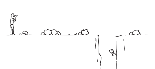
Erkennen von Hemmnissen und Ängsten